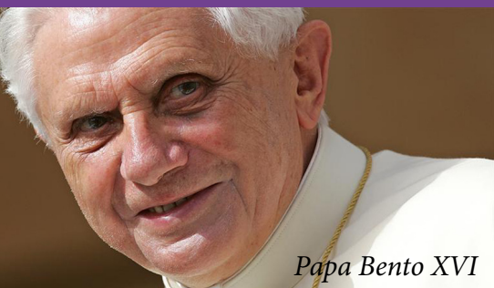
Papa Bento XVI