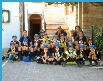
A Caçada a Assis , levou os lobitos da Alcateia 14 de Montemor-o-Novo a conhecer Itália.

PARA ENVIARES AS TUAS NOTÍCIAS ENVIA UM E-MAIL PARA SRC@EVORA.CNE-ESCUTISMO.PT COM A DESCRIÇÃO DOS ACONTECIMENTOS E ALGUMAS FOTOS, SE TIVERES.