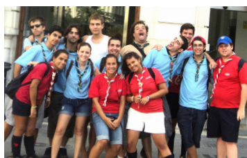
O Clã do 320 de Évora meteu a mochila às costas e foi conhecer Espanha, num IntraRail .