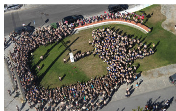
O Dia da Região marcou o encerramento das comemorações dos 75 anos.