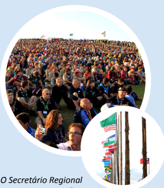
O Secretário Regional para a Comunicação esteve no 22º Jamboree Mundial e conta-nos como foi.