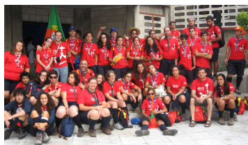
O Clã do 158 de Elvas e a Comunidade do 890 de Évora estiveram nas Jornadas Mundiais da Juventude .